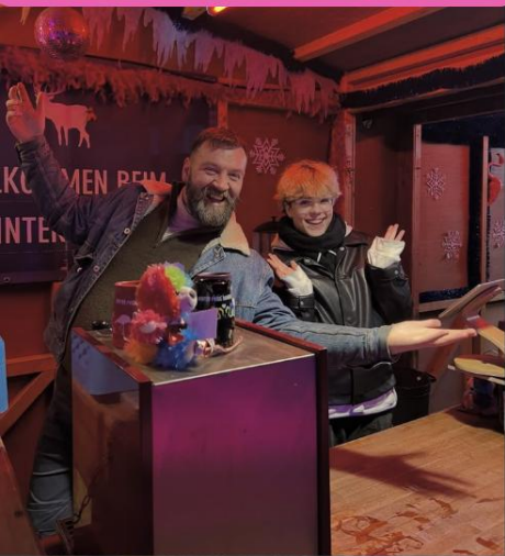
Glühwein ausschank auf der Winterpride