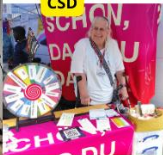
Älterwerden unterm Regenbogen beim CSD