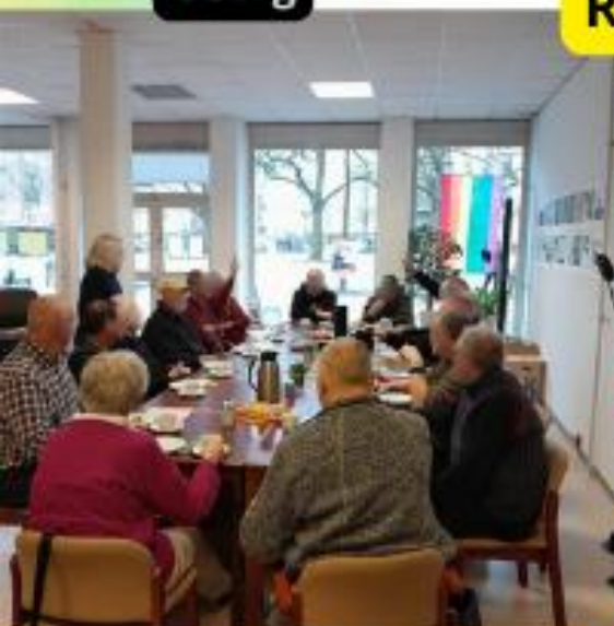
Kaffeeklatsch unterm Regenbogen im LAB-Treff St. Georg